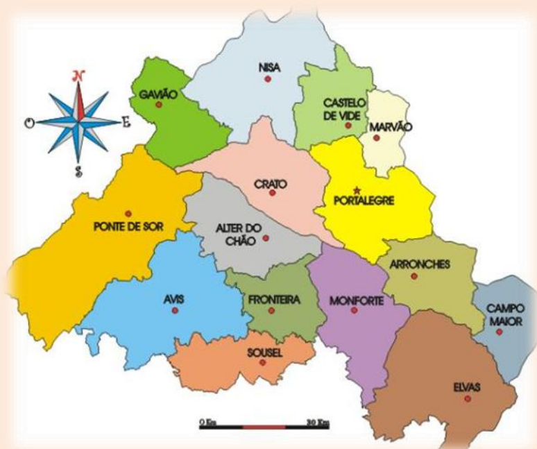
Mapa do distrito de Portalegre

O concelho de Monforte pertence ao distrito de Portalegre.